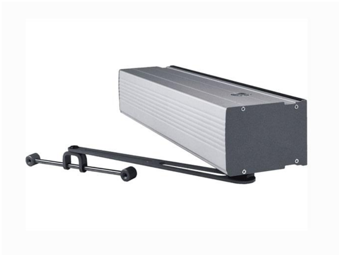
Фото Привод для одностворчатых распашных дверей CAME 001PB1100

Отправьте запрос на коммерческое предложение и получите индивидуальные цены и сроки поставки