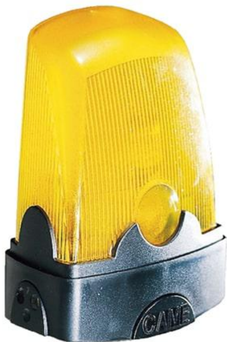
Фото Сигнальная лампа (светодиодная) 24 В CAME 001KLED24

Отправьте запрос на коммерческое предложение и получите индивидуальные цены и сроки поставки