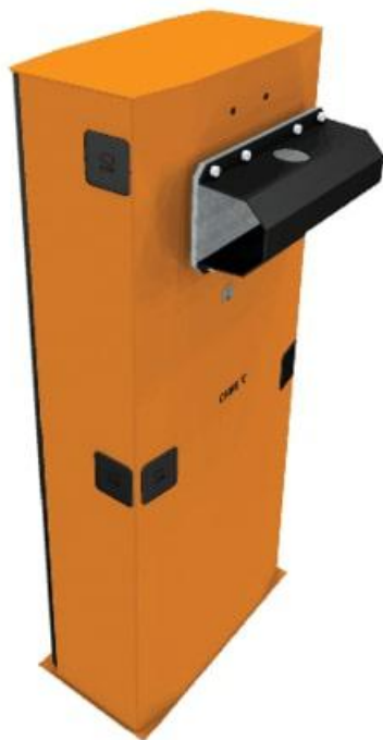
Фото Тумба для шлагбаума G6500 CAME 001G6500

Отправьте запрос на коммерческое предложение и получите индивидуальные цены и сроки поставки