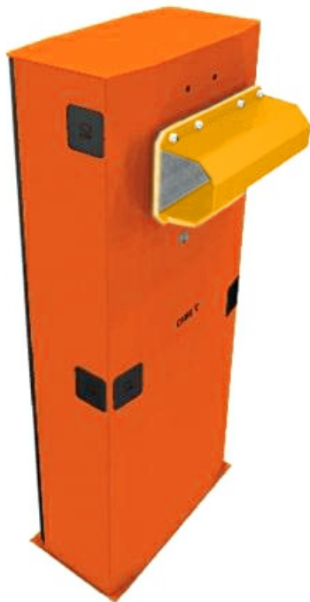
Фото Тумба шлагбаума G5000 CAME 001g5000sx

Отправьте запрос на коммерческое предложение и получите индивидуальные цены и сроки поставки