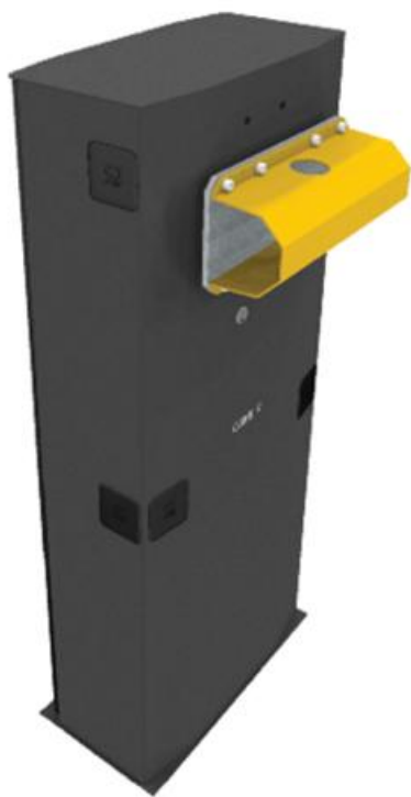
Фото Тумба шлагбаума из оцинкованной и окрашенной стали, класс защиты IP54 CAME 001G5000

Отправьте запрос на коммерческое предложение и получите индивидуальные цены и сроки поставки