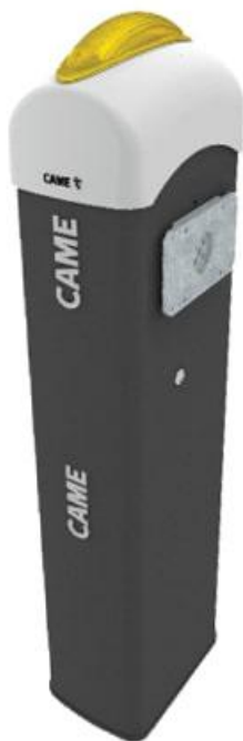
Фото Тумба шлагбаума G3000SX CAME 001G3000SX

Отправьте запрос на коммерческое предложение и получите индивидуальные цены и сроки поставки