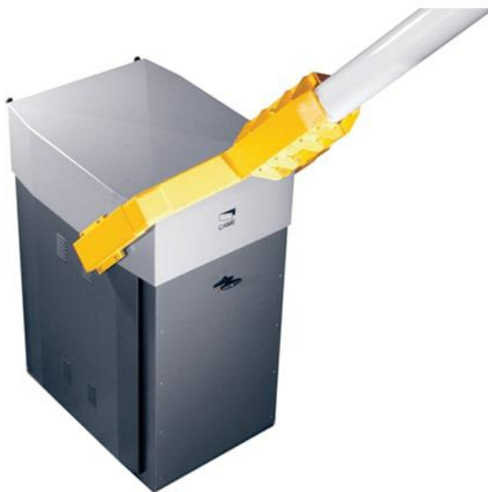
Фото Тумба шлагбаума из оцинкованной и окрашенной стали CAME 001G12000K

Отправьте запрос на коммерческое предложение и получите индивидуальные цены и сроки поставки