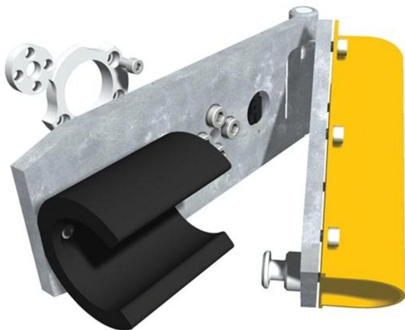
Фото Система защиты при столкновении автомобиля с круглой стрелой (G0402) для шлагбаума G4040 CAME 001G04001

Отправьте запрос на коммерческое предложение и получите индивидуальные цены и сроки поставки