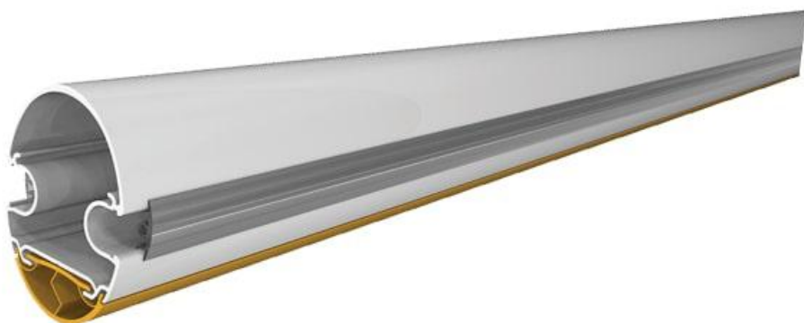
Фото Стрела полуовальная алюминиевая длиной 3000 мм CAME 001G03750/3

Отправьте запрос на коммерческое предложение и получите индивидуальные цены и сроки поставки