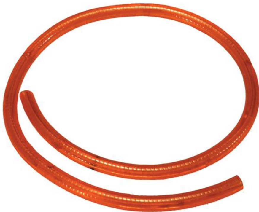
Фото Дюралайт со светодиодами (8 м) CAME 001G028401/8

Отправьте запрос на коммерческое предложение и получите индивидуальные цены и сроки поставки