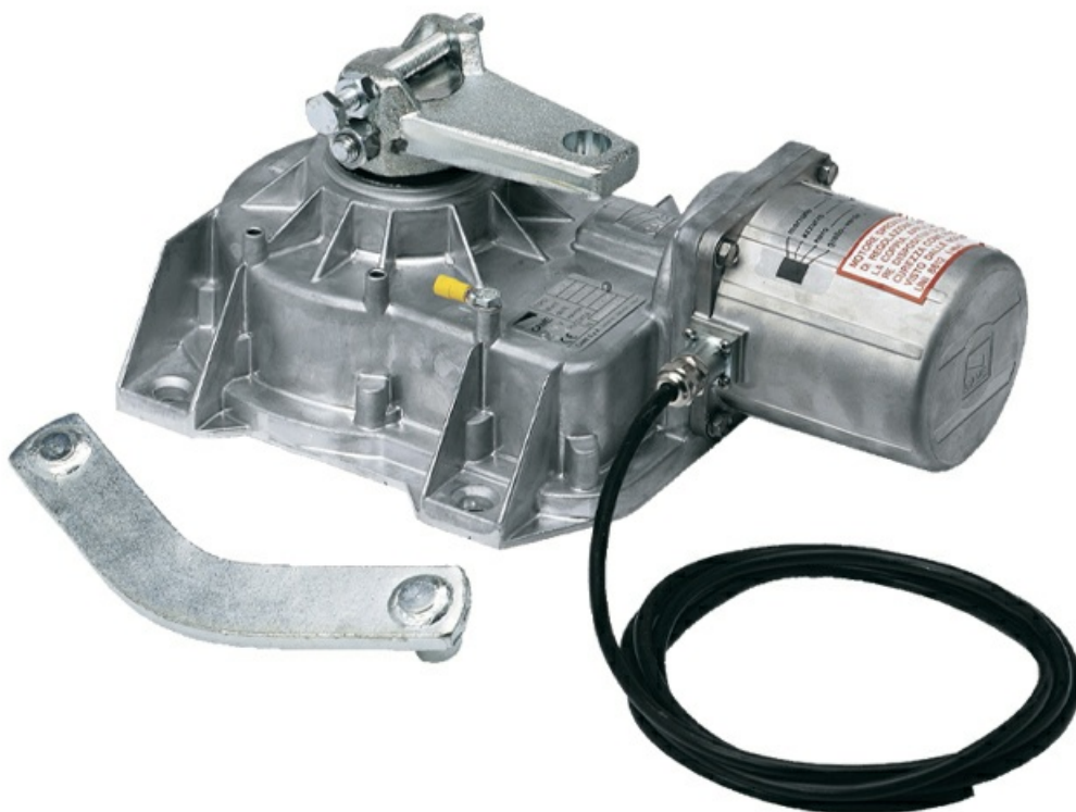
Фото Привод 24В рычажный подземной установки CAME 001FROG-A24E

Отправьте запрос на коммерческое предложение и получите индивидуальные цены и сроки поставки