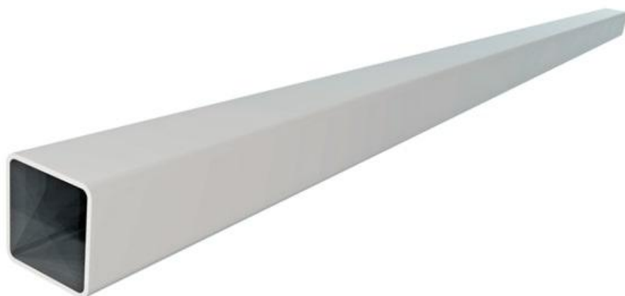
Фото Труба передачи 25 x 25 мм, 3 м CAME 001E782A

Отправьте запрос на коммерческое предложение и получите индивидуальные цены и сроки поставки