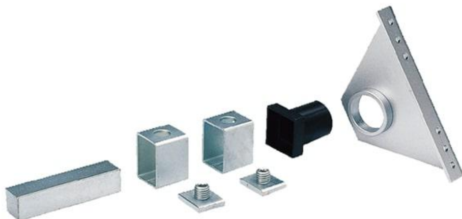
Фото Принадлежности для передающей системы E781A 001E781A

Отправьте запрос на коммерческое предложение и получите индивидуальные цены и сроки поставки