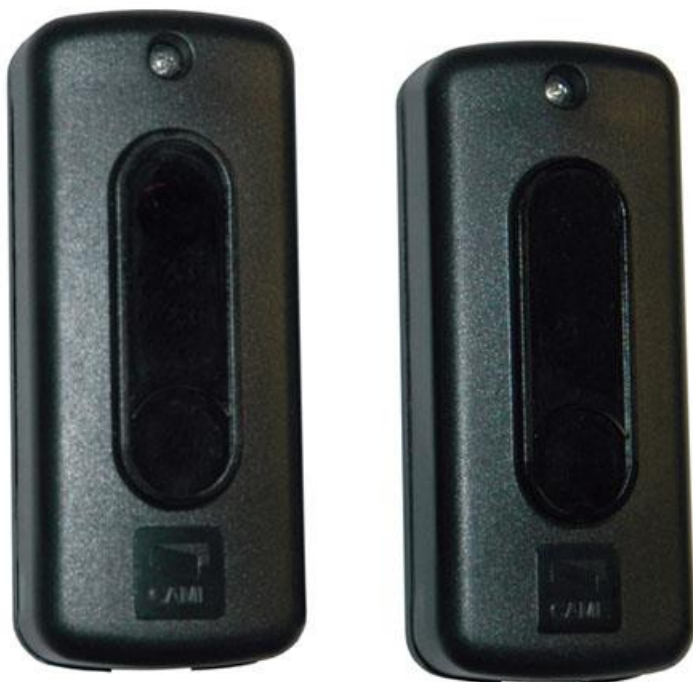
Фото Фотоэлементы / передатчик, приемник / накладные CAME DIR10 001dir10

Отправьте запрос на коммерческое предложение и получите индивидуальные цены и сроки поставки