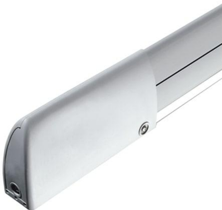
Фото Профиль резиновый, чувствительный с механическим контактом 1500 мм CAME 001DFWN1500

Отправьте запрос на коммерческое предложение и получите индивидуальные цены и сроки поставки