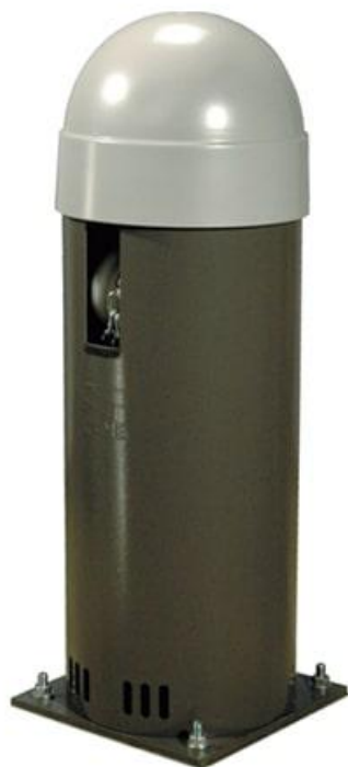
Фото Колонна с приводом и блоком управления CAME 001CAT-X24

Отправьте запрос на коммерческое предложение и получите индивидуальные цены и сроки поставки