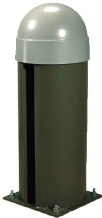
Фото Колонна с противовесом и системой натяжения цепи CAME 001cat-i

Отправьте запрос на коммерческое предложение и получите индивидуальные цены и сроки поставки