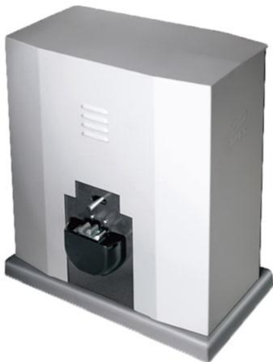
Фото Привод 380 В для откатных ворот (встроенный блок управления ZT6) CAME 001BY-3500T

Отправьте запрос на коммерческое предложение и получите индивидуальные цены и сроки поставки