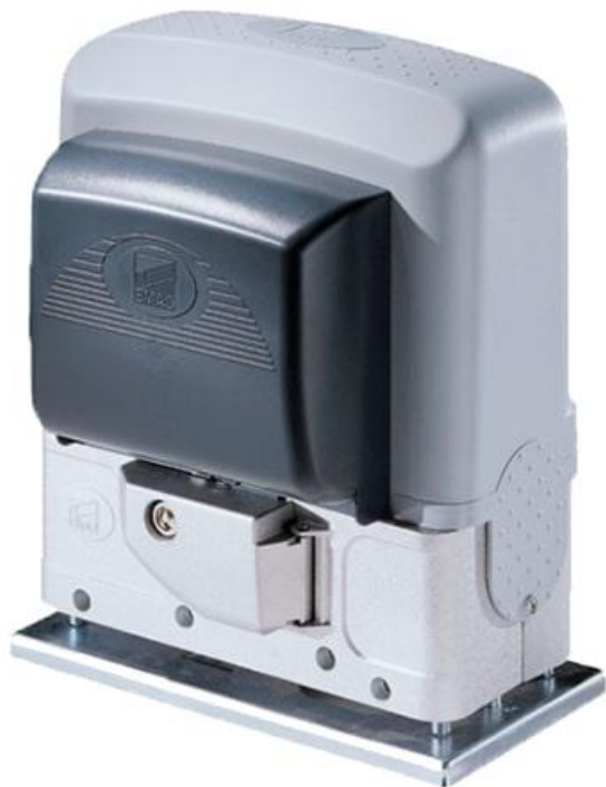
Фото Привод для откатных ворот ВК-221 САМЕ 001ВК-221

Отправьте запрос на коммерческое предложение и получите индивидуальные цены и сроки поставки